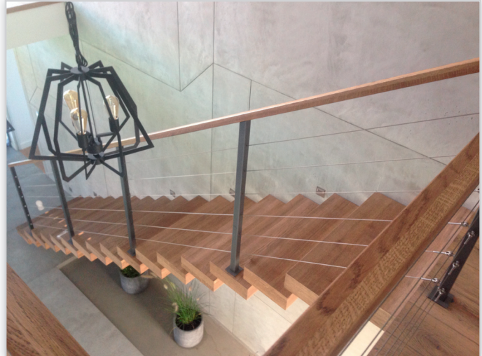
Schody wspornikowe, balustrada malowana proszkowo, wypełnienie linki nierdzewne