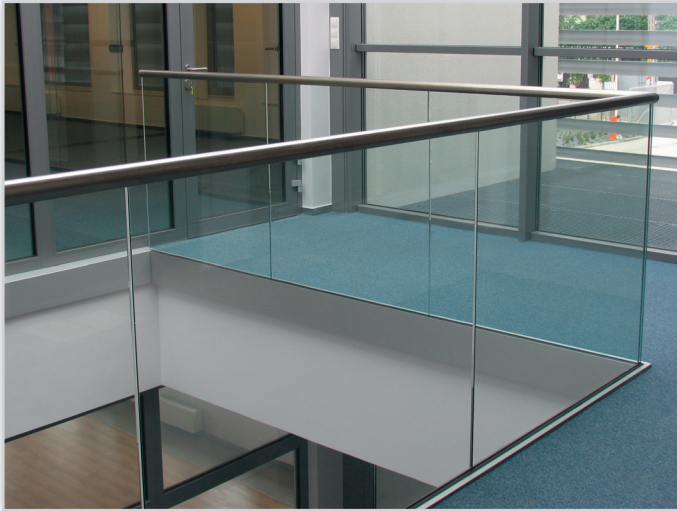
Balustrada szklana samonośna, szkło bezpieczne