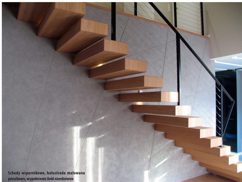
Schody wspornikowe, balustrada malowana proszkowo, wypełnienie linki nierdzewne