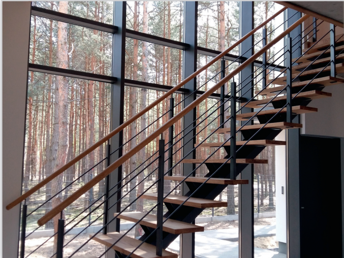
Schody z balustradą stalową