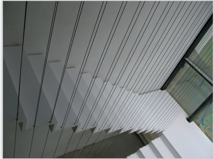
Schody dywanowe malowane proszkowo, balustrada linki nierdzewne