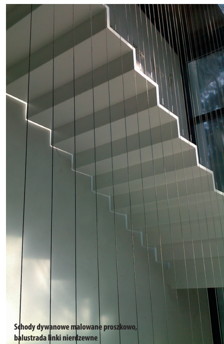
Schody dywanowe malowane proszkowo, balustrada linki nierdzewne