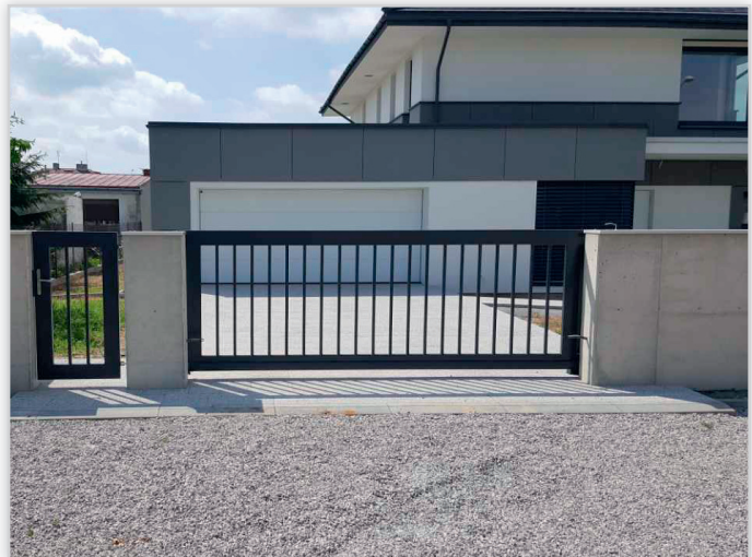
Ogrodzenie ocynkowane oraz malowane proszkowo