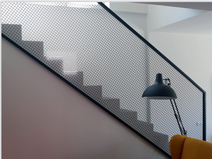
Balustrada malowana proszkowo